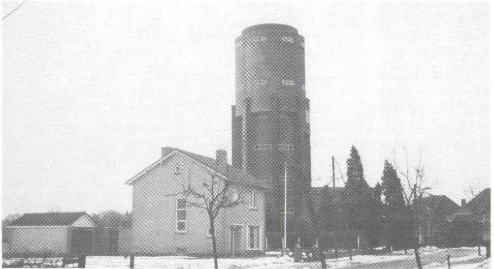
De watertoren aan de Oranjelaan in februari 1962.

De toegangsdeur bevindt zich aan de straatzijde in een soort middenrisaliet, die aan weerszijden wordt geflankeerd door een vierlicht venster van liggend formaat ter breedte van het hele travee. In de bovenste cilinder zijn drielicht vensters, eveneens van liggend formaat, aangebracht. Deze hebben betonnen kozijnen.