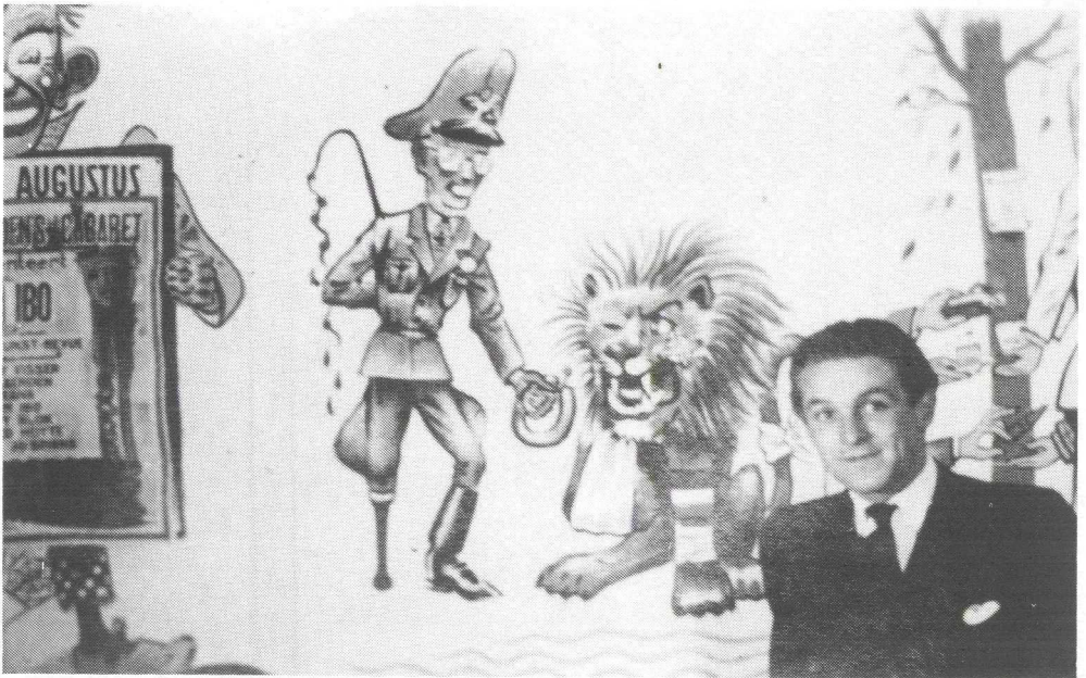
Een detail van de toepasselijke muurschilderingen, die door een Larense kunstenaar op de muren in de theaterzaal in de voormalige bunker waren aangebracht.