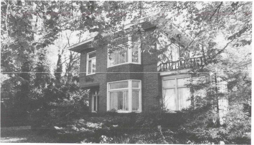
Villa "de Klinge", Amersfoortsestraat 106, gebouwd in 1929, stond schuin tegenover "De meijerij". Het perceel werd in december 1997 gesloopt. (28-10-1997)

Gelukkig is al het opgesomde (en nog héél wat meer) nauwgezet gefotografeerd, zodat de afbeeldingen - dat is ons streven - nog eeuwenlang kunnen worden bekeken. Ter geruststelling: óók de RABO-bank kunt u in de collectie zien. Kan-ie eventueel aan de hand van de foto's worden herbouwd.