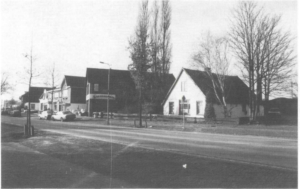
Verdwenen, beeldbepalende Soester huisjes, zoals Kerkstraat 34 (01-05-1996)